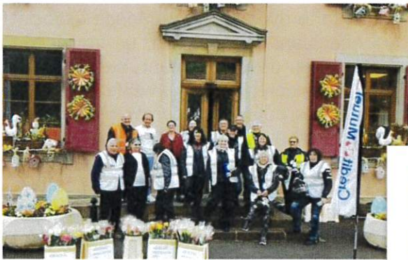
Une rose un espoir Samedi 30 avril 2022