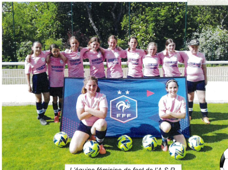
L'équipe féminine de foot de l'A.S.R. Dimanche 15 mai 2022 à Dijon