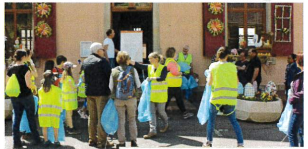
Nettoyage de printemps Samedi 07 mai 2022