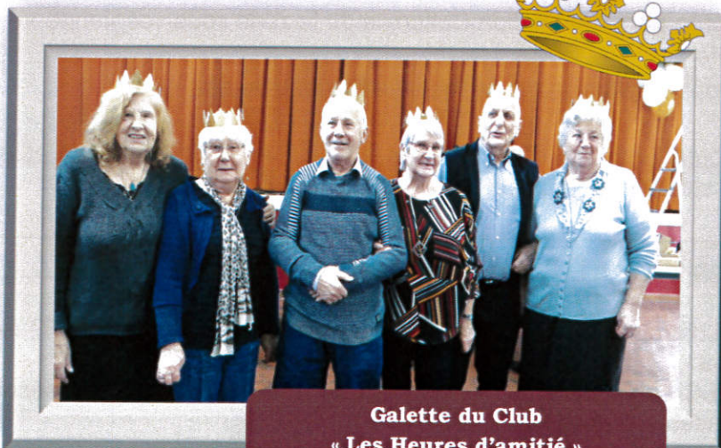
Galette du Club « Les Heures d'amitié » Jeudi 09 janvier 2020