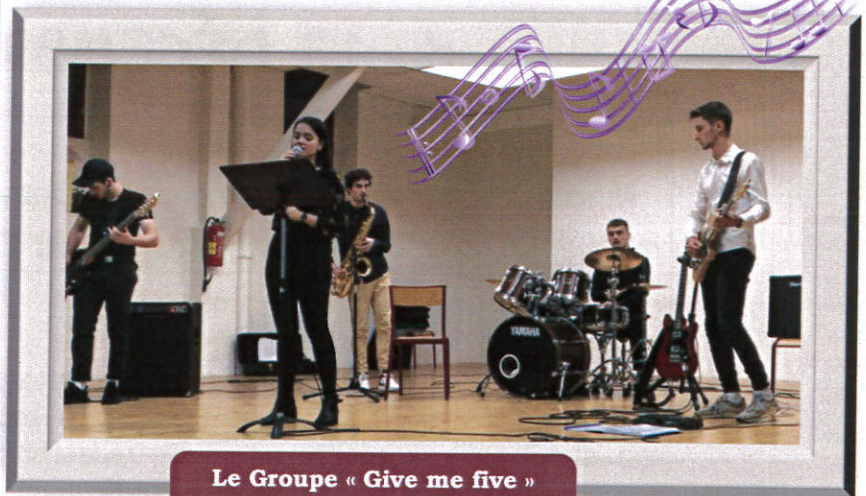
Le Groupe « Give me five » Samedi 04 janvier 2020