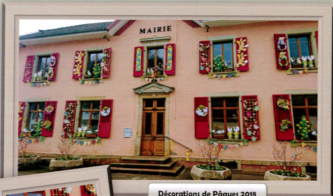
Décorations de Pâques 2018