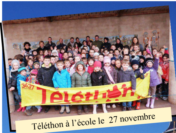
Téléthon à l'école le 27 novembre