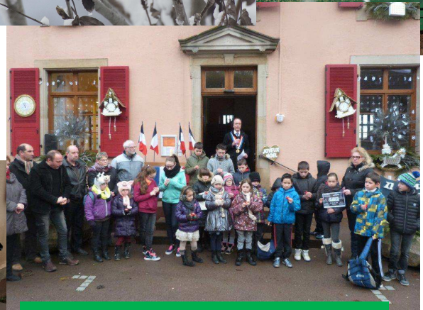
Rassemblement devant la Mairie Dimanche 11 janvier 2015